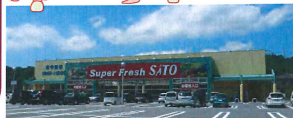
↑スーパーフレッシュさとう豊岡九日市店